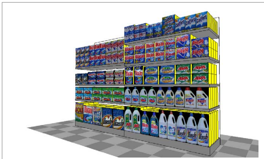
Un esempio di lineare creato da Apollo.

questo strumento in modo tale che nel momento in cui viene rilevato un prodotto già esistente in anagrafica, la rilevazione viene velocizzata.